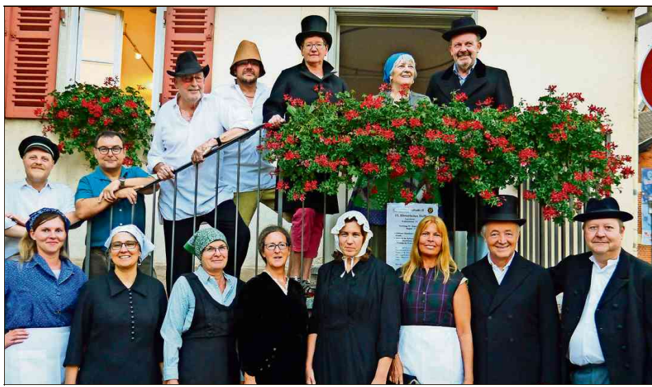
Etwa 50 Personen sind an dem bewegten Bürgertheater als Schauspieler und Statisten beteiligt. Einige der Kostüme und Requisiten stammen aus dem 19. Jahrhundert.

Aufführung Die Vereine führen das Bürgertheater mit dem Titel Eglshausener Jakobsgang am Samstag, 29. September auf. Beginn ist um 15 Uhr am ehemaligen Rathaus in der Katharinenstraße in Eglshausen. Der Eintritt ist frei.