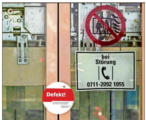
Ein häufiger Anblick in Freiberg. Noch?

Im Inneren des Bahnhofs stand die Modernisierung der drei störanfälligen Lifte an – was dazu geführt hätte, dass für die Zeit der Bauarbeiten gar keine Aufzüge betriebsbereit gewesen wären. Nach landläufiger Beobachtung sind die inzwischen neuen Aufzüge noch immer in regelmäßi-